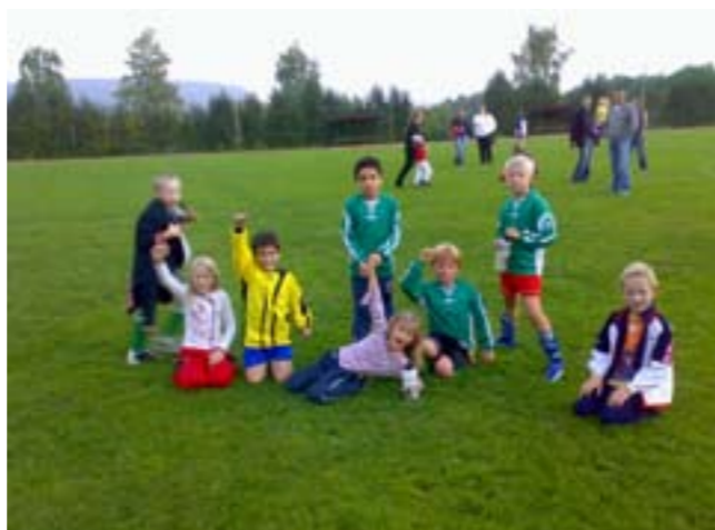
Bilde av 9-års laget