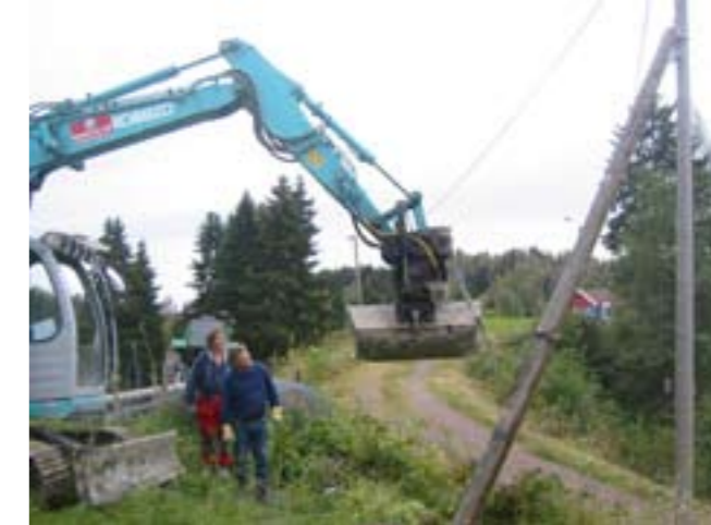
Dugnad i Seterkleiva