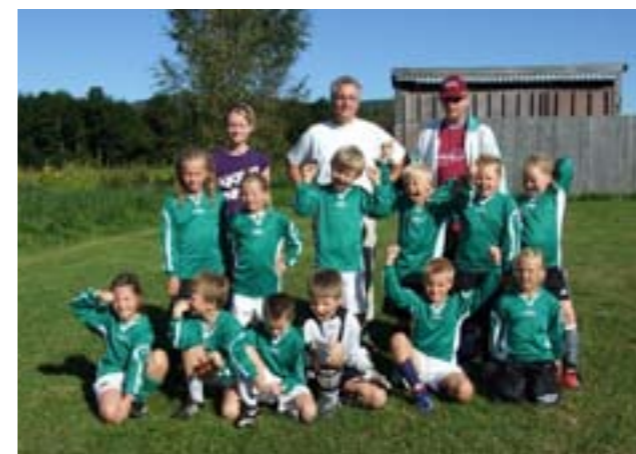
Bilde av 9-års laget