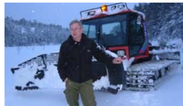
Historiske turen 26. februar frem til Suluvannet.

Når det gjelder vedlikeholdet av fotball banen er det litt spennende og se hva som skjer siden kommunen har sakt opp avtalen med klipping/ vedlikehold av banen. Dette gjelder også for de to andre banene som finnes i kommunen. Vi synes kommunen fraskriver seg ansvar ved å yte mindre og mindre til idretten. Håper våre politikere snart får opp øynene for at de lagene som har anlegg å drifte må få mer hjelp. Denne saken med oppsigelsen av vedlikeholdet av fotballbanene blir frontet av Idrettsrådet og vi håper dette vil løse seg.