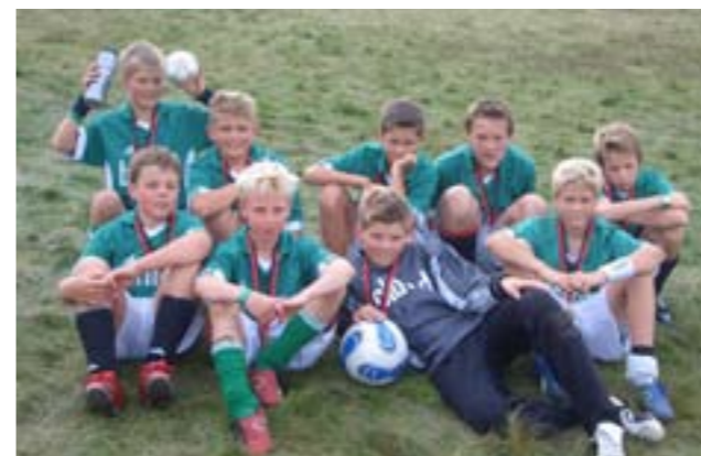
Bilde av 12-års laget