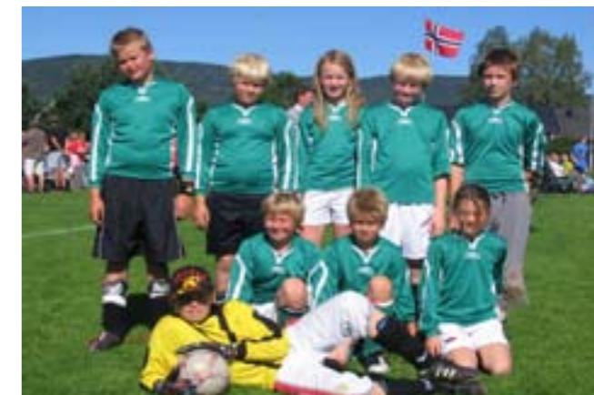
Bilde av 11-års laget