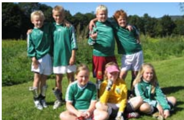
Bilde av 10-års laget